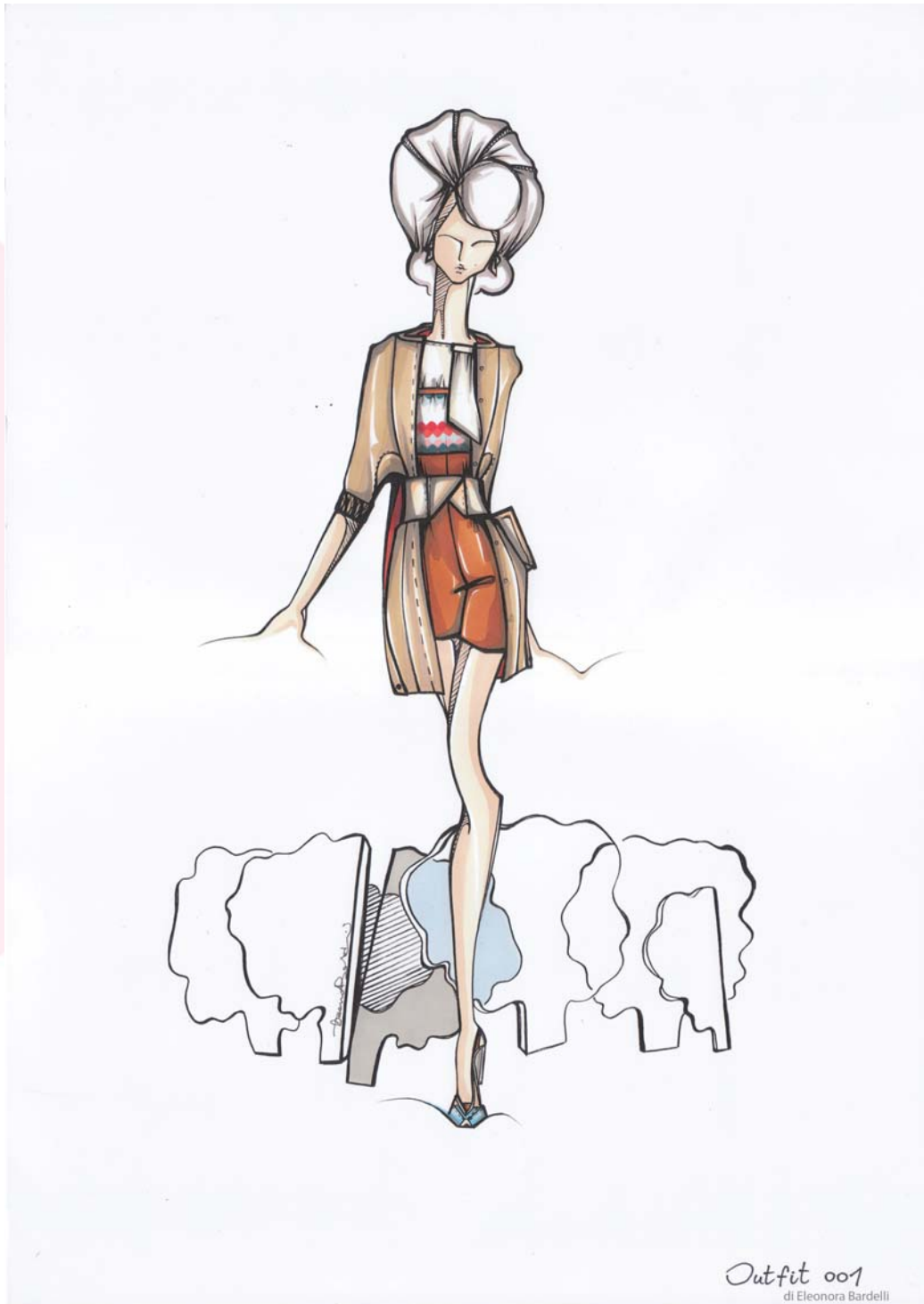
Outfit 001 di Eleonora Bardelli